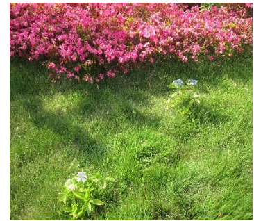
私たち施設にあるあじさいです。小さいながらも元気に花を咲かせ始めました。