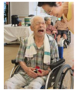
夏まつりの風景 2015/8/22 参加した皆が笑顔に溢れ、素敵な夏の思い出ができました。