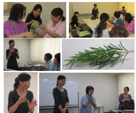
2段目右の画像がローズマリー

当施設において、静岡徳洲苑の方が、アロマテラピーの勉強会を開催してくださいました。この療法は植物が持つ香り、有効成分が凝縮された精油を使い、人間本来の自然治癒力を高めるといふものです。効果としては、健康維持、疲労回復、心身の不調を癒すことで病気になりにくい体質を作ることが期待されています。今回は、採りたてのローズマリー、レモンマートル、レモンバーベナ、ラベンダーなどを味覚・嗅覚でスタッフが体験させていただきました。香りに癒され、疲れも吹き飛びました。いつの日か、利用者様の心と体の癒しにアロマテラピーが実現できればと思います。そのために、日々勉強を重ねて努力していきたいと思っています。