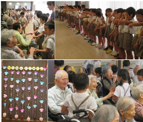
園児の皆さんと利用者様とのふれあい

川崎幼稚園の園児の皆さんが来所し、歌や踊りを披露してくれました。子どもたちの元気いっぱいの姿に、利用者様、スタッフとともにパワーをもらいました。普段、レクリエーションを好まない利用者様も子どもたちの姿をイキイキした表情で見つめ、「可愛いね。元気をもらえるね。」と言う言葉がきかれました。また、最後に園児の皆さんから、どんぐりとおりがみで作成された「げんきでいてね！！」とメッセージが入ったプレゼントをいただき、あじさいからもお菓子をプレゼントさせていただきました。いただいたプレゼントはあじさいで大切に飾らせていただきます。心に残る楽しい時間を過ごさせていただきました。