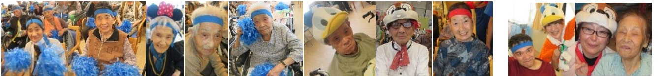
青組&赤組の皆さん