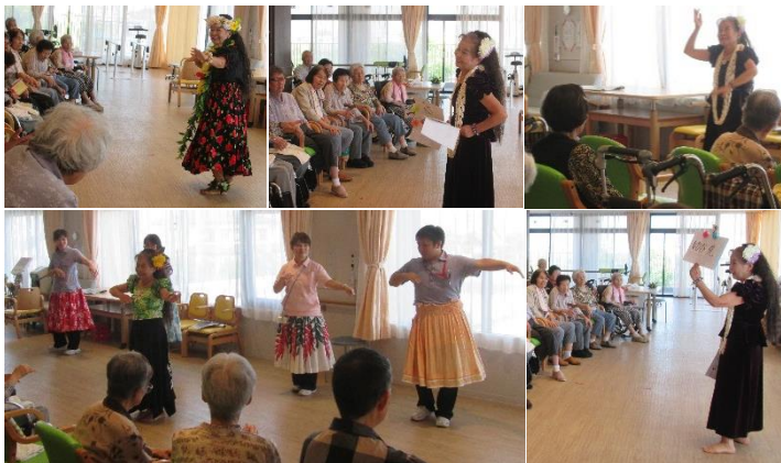
利用者様とスタッフもフラダンスと一緒に体験

フラダンスシスターズ様が慰問にお越しくださいました。フラダンスの披露だけでなく、フラダンスに関するクイズも出題してください、色々なことを知ることができて大変勉強になりました。