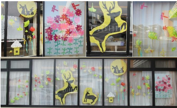
施設の窓に飾りつけてあります

左の写真は9月、10月の通所でのレク作品です。お月見のうさぎとお団子、もみじ、トンボ、コスモスが秋を表現している作品になっています。スタッフは、完成した作品を初めて見た時、感動のあまり「わあ、すごい！」と声をあげてしまいました。皆さんとものづくりをしながら季節を感じられることは素敵ですね。秋の催しが見事に彩られ、あじさいの外観も華やかになりました。