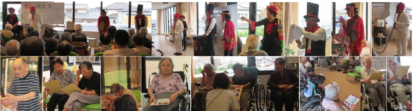
利用者の皆さんの喜ぶ顔がたくさん見られました

皆さん、手ぬぐいを気に入ってください、プレゼントを渡すとすぐに開封して首にかけたり、頭にかけていたりしていました。皆さんの喜ぶ姿が見られて、嬉しかったです。これからも皆さんが笑顔で楽しく施設で過ごしていけるように、スタッフ一同力を合わせて頑張ります。