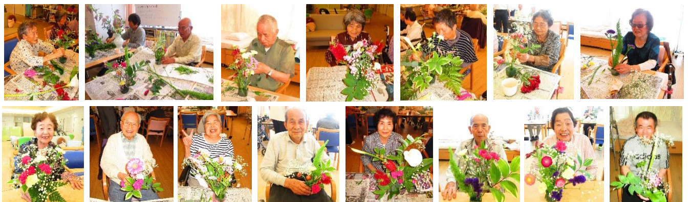
平成29年5月29日・30日 通所リハビリ利用者の皆様