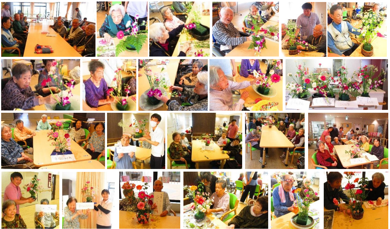
平成29年5月15日・16日 入所利用者の皆様

5月の行事イベントで、フラワーアレンジメントを実施しました。入所では、5～6のグループに分かれて、通所リハビリでは、個人で自分なりのフラワーアレンジメントを行いました。入所・通所リハビリの利用者の皆さんからは、お花を見て、「キレイだね。」「可愛いお花だね。」という声が聞かれました。女性の利用者様だけでなく、男性の利用者の皆さんもお花に興味を持ってくださり、楽しそうに、お花を生けていました。入所の作品は入口の通路や各階に飾らせていただきました。通所リハビリでは、生けたお花をお家へお土産としてお持ち帰りいただきました。利用者様とスタッフで充実した楽しい時間を過ごすことができ良かったです。