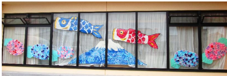
通所リハビリ作品