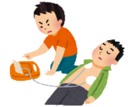
溺水の実践研修の風景 2015/7/24