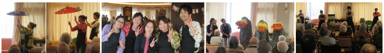
リハビリスタッフ