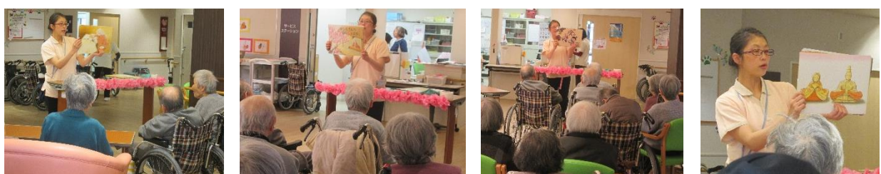
1階・2階のひなまつり会の様子